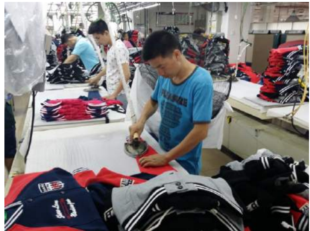
休閒服整熨車間工人忙於工作，一件件服裝疊起。