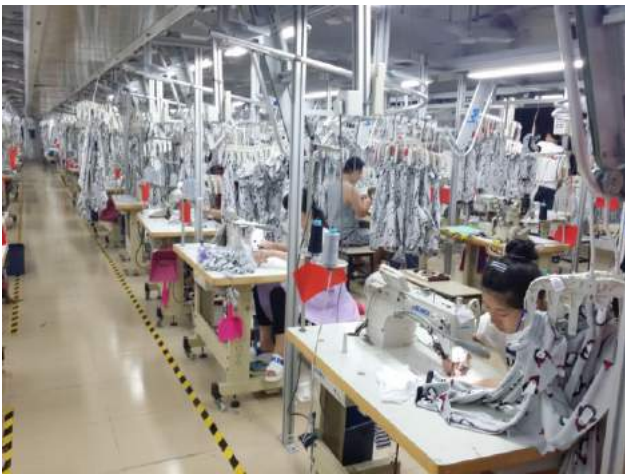
季度訂單要完成 500 萬件服裝，吊掛系統吊滿裁片。

以一家新廠房投產只有 5 年的民營企業，工人能夠接受這種服裝加工新概念的科技化管理與技術，可想而知中國新一代輕工產業勞工擁有知識水準和適應能力。這是我對這家看似平凡工廠所得到一個新的印象和具備新的說服力。