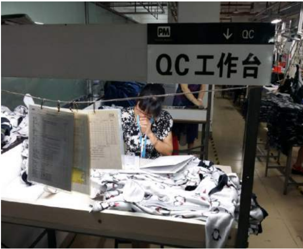
QC 崗位上檢驗員認真把關，檢驗成品。一份份統計資料掛在當眼處，方便查閱。