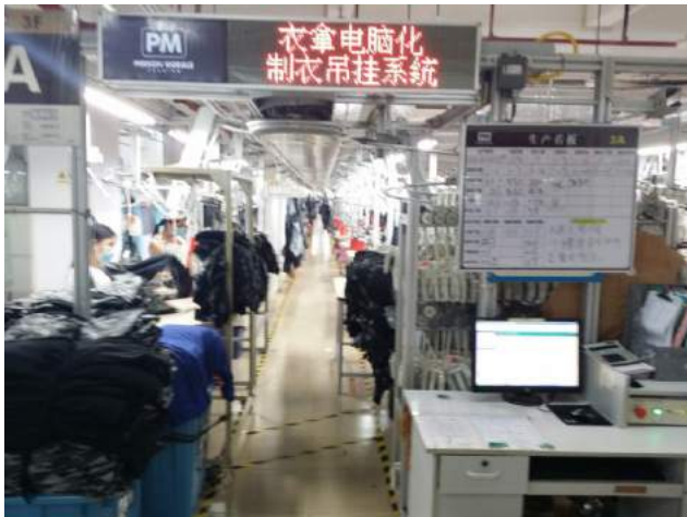
風度仕的生產吊掛系統生產線，流水作業全電子化，全部生產數據在電子螢幕上即時顯示。

筆者高興見到，盡管天氣悶熱，但工人在現代化生產線上工作是專注而全程投入，吊掛系統車籃不斷轉動到車位，車工都能熟練應付自如，有條不紊。而用電子監控整條生產線全流程上，見到的工人是各司其職、分工合作、全神貫注。而所有生產數據、資料、時間、統計全部打在電子螢幕上，人人見到。