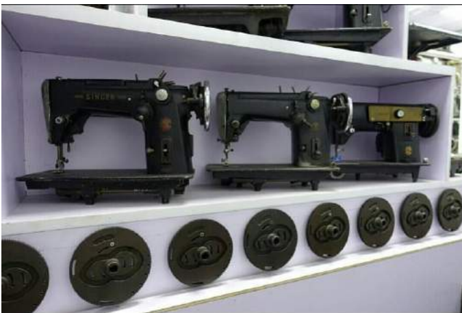
五、六十年代家用萬能衣車，在星馬一帶流行，一機多用。 下邊一排圓盤是開鈕門專用的夾盤， 裡面有一個內 8 字形狀。