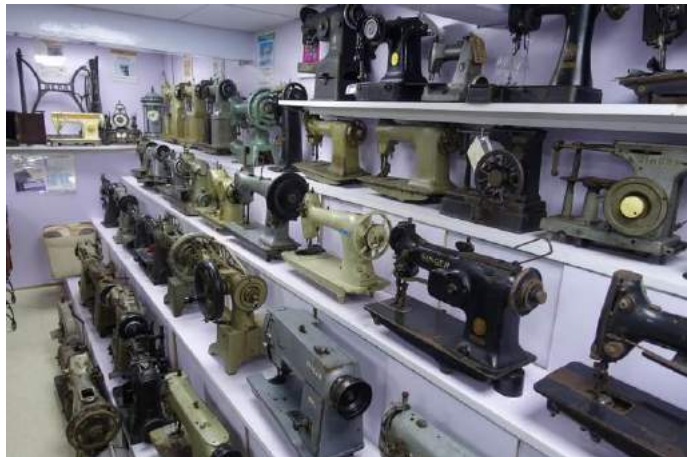
陳列室一字排開的各種早期工業縫紉機， 代表一個時期的製造業發展水平。

他通過 16 年的努力，目前手上擁有古董衣車有三百多台，需要在東莞店舖分設兩個專設陳列室擺放，並按手搖車、微型衣車、工業系列衣車、特種性能衣車，四大類來分類整理擺放，最得意的是一台由美國波士頓製造的，帶木箱盒的手搖動家用衣車，1885 年製造，距今已 161 年，目前只搜集到一台，想再買，沒有人透露資料，也不知市場上還有多少台。