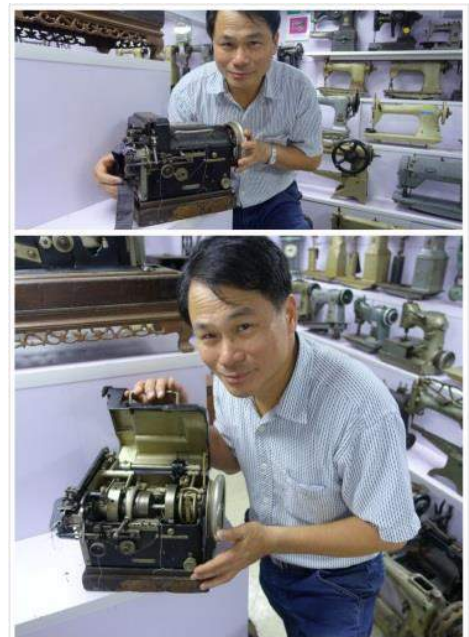
由兩張照片合併，可以見到這台做西裝假珠邊機的外殼和內裡機械構造，看似結構簡單，但構造嚴謹，佈局合理，設計者匠心獨運。

收購過程：經朋友協助，五年前在英國伯明翰收購。事前在網上搜尋得知此機，高價始收到。目前要再收購一台，已無貨源。