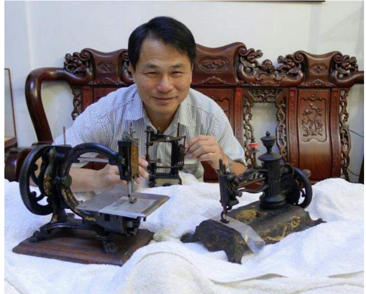
右邊一台用郵筒設計做針柱筒縫紉機，光設計造型頗費心思，郵筒頂上還設計一個倒三角型的花冠，爪型腳，惹人好感。

收購過程：四年前在網上得知此機，通過朋友幫助，在美國收購成功。收購價合理，競價在時間上搶先人一步，是香港目前唯一一台此造型的古董家用衣車。也是在所有車款之中，最喜愛的車型。