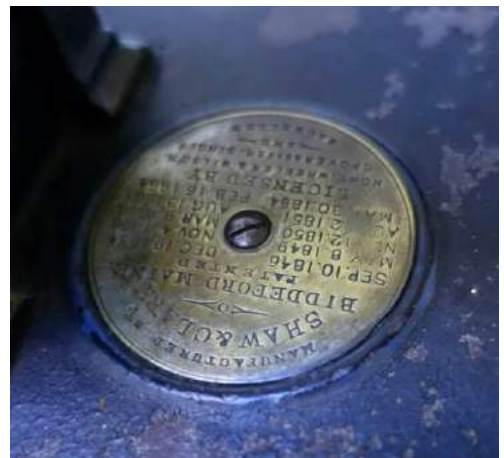
縫紉機發明專利，工廠是用銅牌鑿字方式將 1846-1854 年間的五項專利刻上去，並嵌在機面上，讓使用者知道。一百七十年前，知識產權及專利自我保護意識，在縫紉機身上可看到受人尊重的程度。