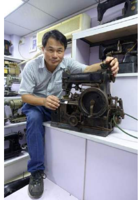
勝家衣車製造的鳳眼車，是工業衣車機械構造一大突破產品，眾設計師集體智慧的成果，想法大膽，設計新穎，是後期所有鳳眼車的「開山鼻祖」。

後期的鳳眼車的設計、創新，其基本原理都源自於勝家這台車的原理與運動規律，具備深厚的物理、數學知識。