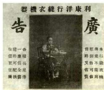
利康洋行的縫紉機廣告