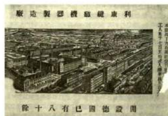
利康縫紉機制造厂全景