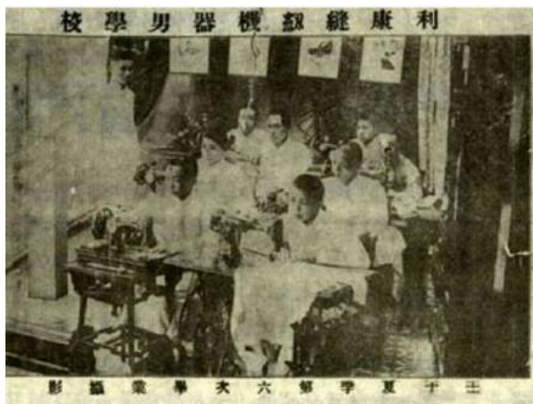
利康縫紉學校學生的“畢業照”

照片中所列的利康第 28 型有木箱遮蓋的家用腳踏衣車，1914 年售價是大洋 54 元，拔期（即分期付款）是 60 大洋，價格不菲。當時一名上海油漆店學徒工月薪是大洋 2 元。換句話說，學徒想買一台衣車謀生，要用五年工資。