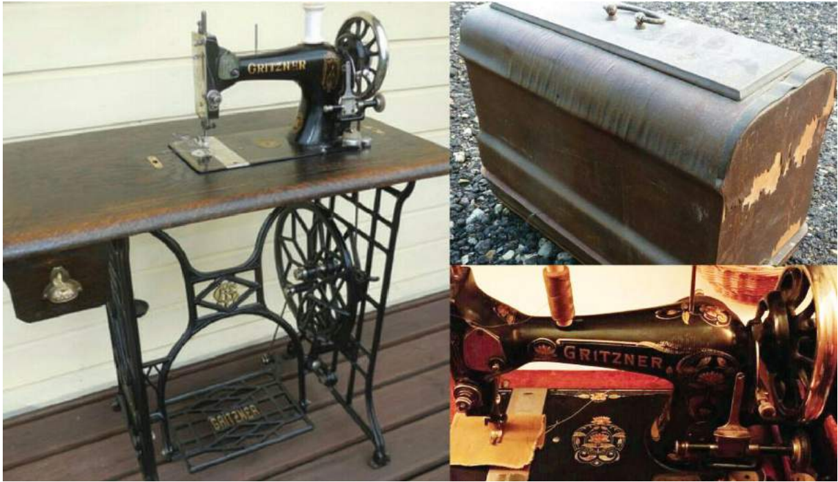
德國 Grizner 品牌家用衣車，車頭印牌子英文字，清晰可見，造工精緻，車腳有牌子標誌，而且有盒蓋裝。百年後仍然有實用價值。

份支架形狀，完全是一模一樣，清晰照片中商標的 Grizner 字樣十分工整，比書籍中那張模糊不清的老照片，質量不知好多少倍，令人刮目相看。