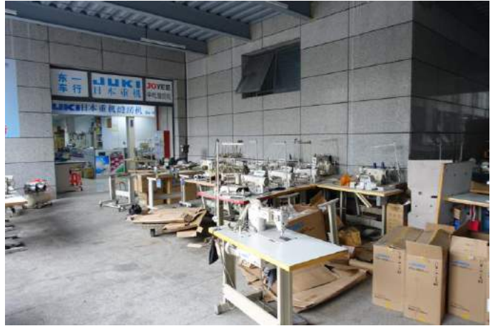
針車城管理乏善，通道出口空位到處散放針車枱，散亂不堪。

筆者一行人在針車城溜達了一小時多。以觀察所得，城內硬體是具備的，但無奈時機不配合，城內營商環境、氣氛明顯欠缺，商場內死氣沉沉，十室九空。即便已開業針車店，大都是門可羅雀。午飯後睡意瀰漫商場內，隨處可見。不少已租店舖只掛了一條招牌橫額，人去樓空，甚至一些不太值錢的樣板，也懶得搬走。